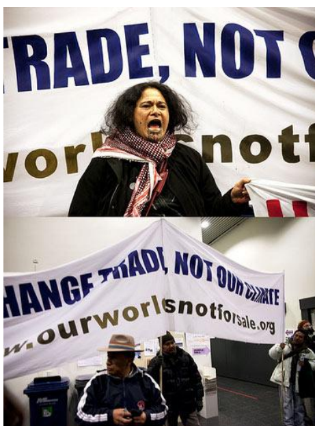
Arrivée de la Caravane « Du commerce au climat », partie de Genève (sommet de l'OMC)